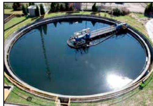
Depuratore in azione.

L'ipotesi che il problema della depurazione del Garda sia scaricato sul fiume Chiese ha trovato da sempre la contrarietà del nostro Circolo, che ha sostenuto le azioni intraprese sulla questione dall'amministrazione Fraccaro.