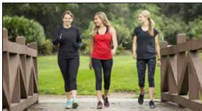
La passeggiata in inverno.

L'assurdo è, per contro, incontrare le stesse persone che, la mattina presto o più spesso la sera, sostituiscono gli abiti eleganti con comode tute, tacco 12 o comunque calzature eleganti con scarpe da ginnastica e, quasi sempre in compagnia, vanno a camminare a passo spedito, qualsiasi temperatura ci sia, perché, se glielo chiedi "Camminare abbassa la pressione, migliora la circolazione, aiuta a mantenere la linea...", me l'ha consigliato il medico, l'esteti-