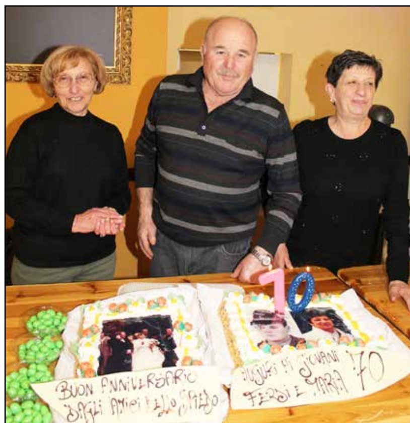
I festeggiati davanti alla loro torta.