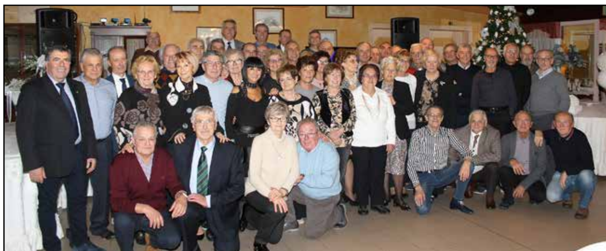
Foto ricordo dei coetanei nati nel 1949.