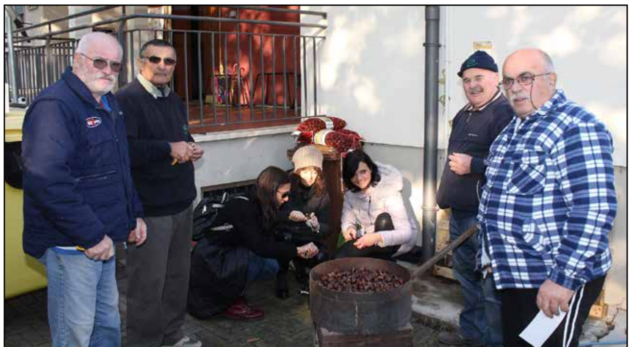
Gli Amici dello spiedo con alcune rappresentanti della scuola.