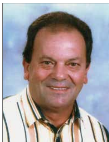
Giovanni Angelo Capra 6° anniversario