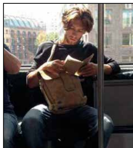
Letto sul bus.

ti quegli attimi della giornata che si passano in solitudine, che altrimenti rischiano di essere dedicati a rimuginare o a scorrere la bacheca di Facebook senza alcuno scopo: mentre assonnati si fa colazione, mentre si aspetta che l'acqua per la pasta bolla, mentre si è al bar ad aspettare l'amico sempre in ritardo, mentre si attende l'ennesimo autobus o treno della giornata o nei cinque minuti